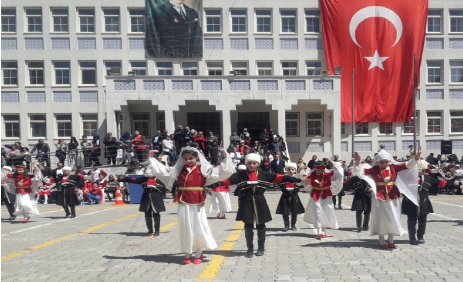
23 Nisan Ulusal Egemenlik ve Çocuk Bayramı Kutlama Etkinliğimiz