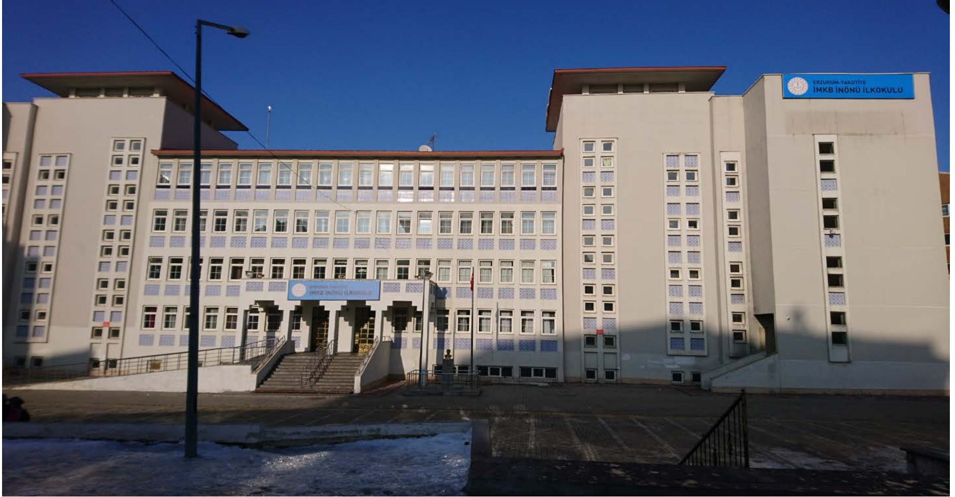
İMKB İnönü İlkokulu